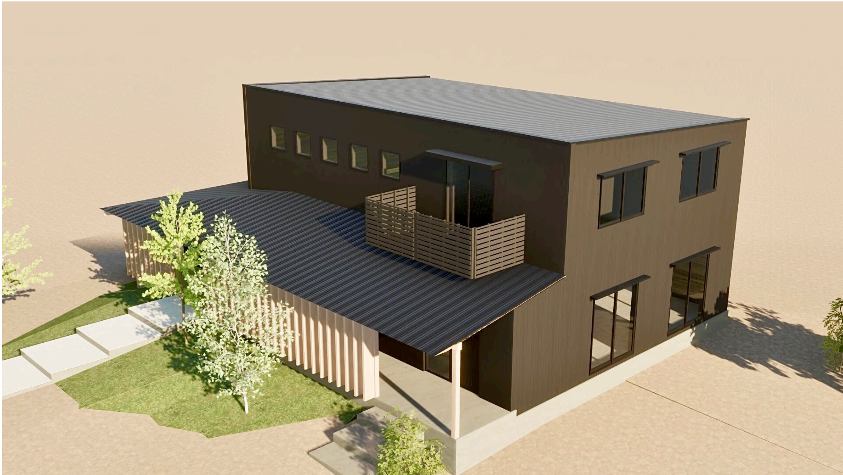
午前の日射のシーン