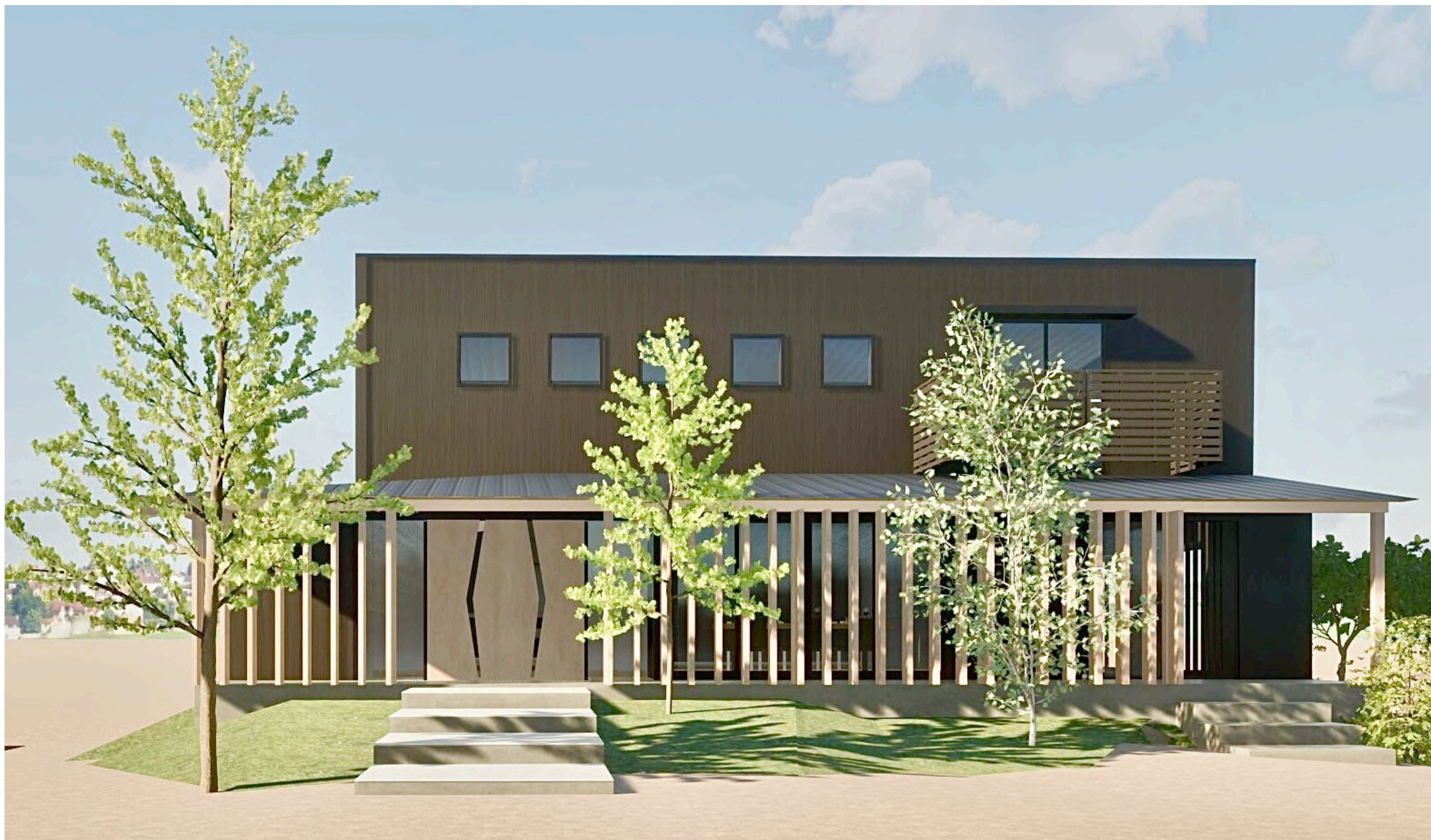
下屋根の水平性と木材と黒外壁のコントラストの見える正面パース

KS15 メトロシルバー (西) マンセル値 7.0YR 6.6/0.2 日射反射率 56%