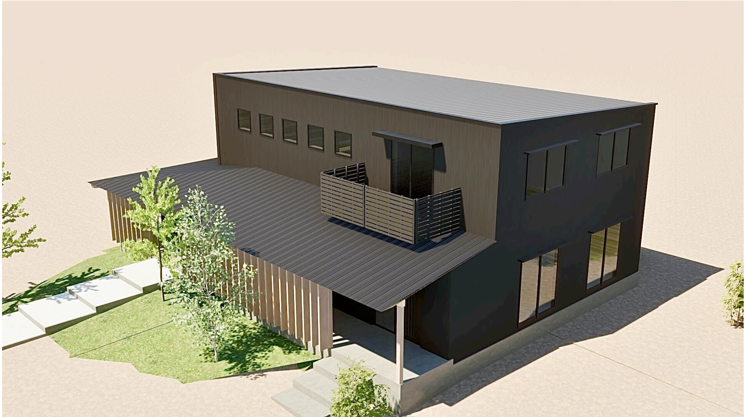
午後の日射のシーン