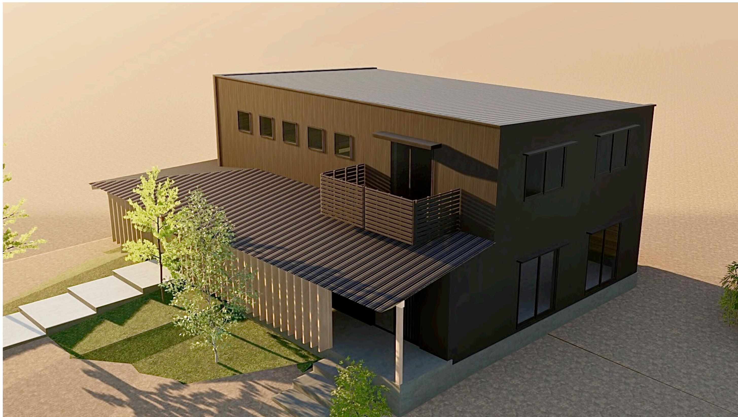
夕方の日射のシーン